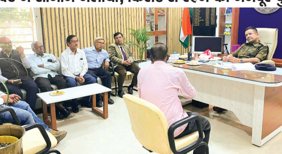
गई। निर्णय लिया गया कि माता-पिता अपने मकान में ही रहेंगे तथा पुत्र उनके लिए आवश्यक सामान, राशन एवं देखभाल की व्यवस्था पुत्र स्वयं पत्नी सहित अन्य किराये के मकान में रहेगा। इस सहमति पर बुजुर्ग दंपति ने संतोष एवं प्रसन्नता व्यक्त की।

बेटे ने सामान जलाया, किराए से रहने को मजबूर बुजुर्ग दंपति को मिला न्याय