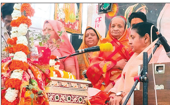
शंकर के रूप का वर्णन