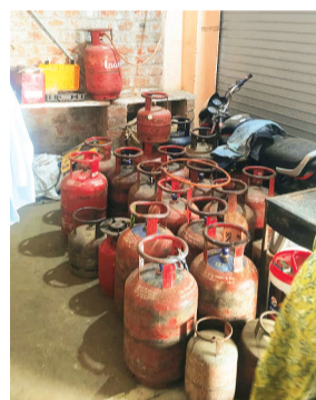
नोजल पाइप और 12 उपभोक्ताओं की पासबुक भी बरामद हुई। जब्त सामग्री की अनुमानित कीमत करीब 66 हजार रुपए आंकी गई है। आवश्यक वस्तु अधिनियम के तहत प्रकरण दर्ज करने की प्रक्रिया प्रारंभ कर दी गई है।