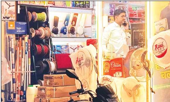
कूलर और पंखों की पूछपूरख हुई शुरू

पिछले अनेक दिनों से आसमान में छाये बादल रहते ही अब सूर्यदेव दमकने लगे हैं। दिन में सुबह 9-10 बजे से लेकर सूरज ढलने तक अब लोगों को गर्मी, उबस परेशान करने लगी है। मौसम परिवर्तन के चल रहे दौर में अर्धरात्रि से सुबह-सुबह हवाओं में